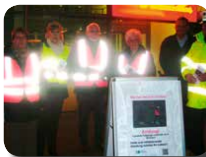
Leuchtend gute Beispiele!

Mit vielen Portanern wurden intensive Gespräche über die mangelnde