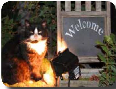
Ein Gruß an die „Neuen“.